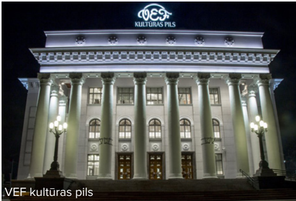
VEF kultūras pils