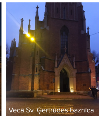
Vecā Sv. Ģertrūdes baznīca