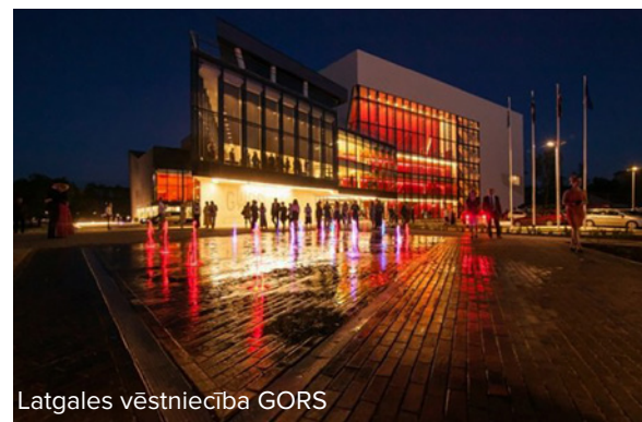
Latgales vēstniecība GORS