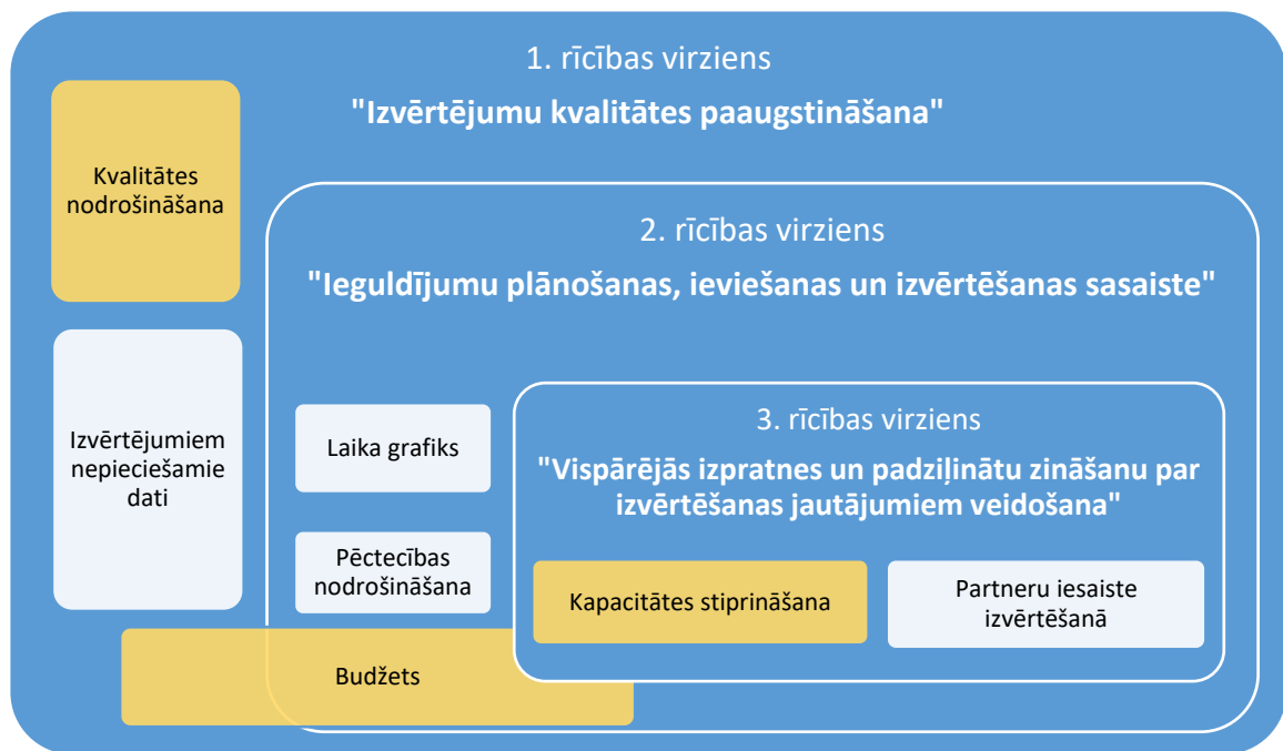
Attēls Nr.1 ES fondu izvērtēšanas nodrošināšana

Izvērtēšanas funkcijas nodrošināšanai kritiski svarīga ir izvērtējumiem nepieciešamo datu pieejamība. Darbības programmā "Izaugsme un nodarbinātība" un tās papildinājumā iekļauto rādītāju vērtības paredzēts uzkrāt Kohēzijas politikas fondu vadības informācijas sistēmā (turpmāk – KPVIS). Tomēr, lai būtu iespējams veikt kvalitatīvus novērtējumus, it īpaši, lai noteiktu ieguldījumu ietekmi, nepieciešama virkne papildu datu, kuru uzkrāšana atsevišķos gadījumos KPVIS nav paredzēta. Lai nodrošinātu izvērtēšanai nepieciešamo papildu datu pieejamību, būtiska ir atbildīgo iestāžu un vadošās iestādes sadarbība jau specifisko atbalsta mērķu (turpmāk – SAM) plānošanas stadijā, definējot papildus izvērtēšanai nepieciešamos datus, nodrošinot to uzkrāšanu vai pieejamību KPVIS vai citos iepriekš noteiktos datu reģistros un nosakot to apkopošanas prasības SAM ieviešanas normatīvajā regulējumā.