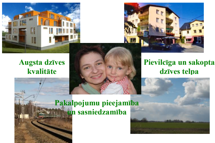
1.att. Dzīves kvalitāte

Lai sekmētu līdzvērtīgus dzīves, darba un vides apstākļus valsts iedzīvotājiem visā Latvijā, dzīves kvalitātes līmeņa tuvināšanu Eiropas valstu līmenim, konkurētspējas paaugstināšanos pārējo Eiropas Savienības reģionu vidū, ir būtiski: